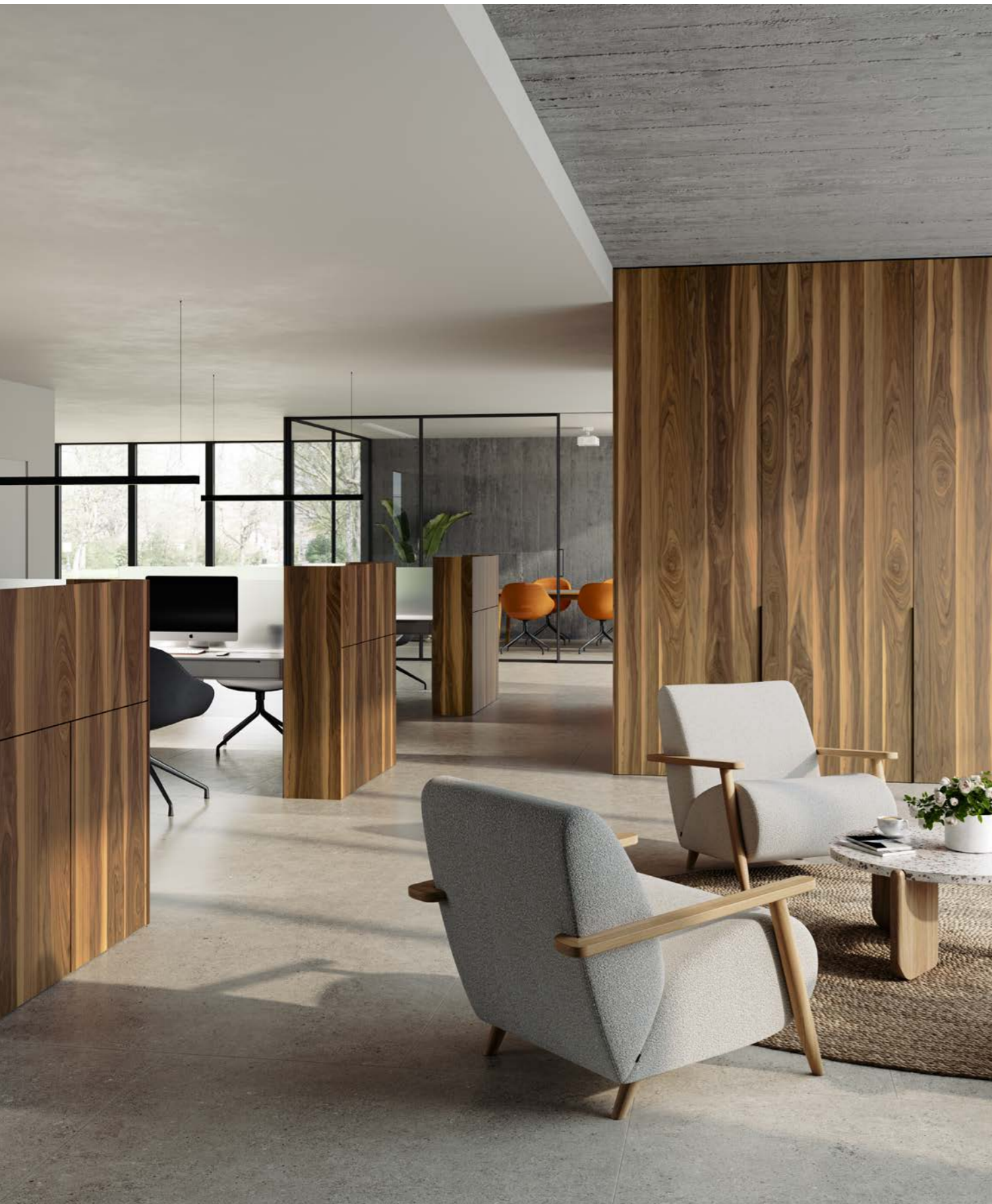
finition vernis transparent