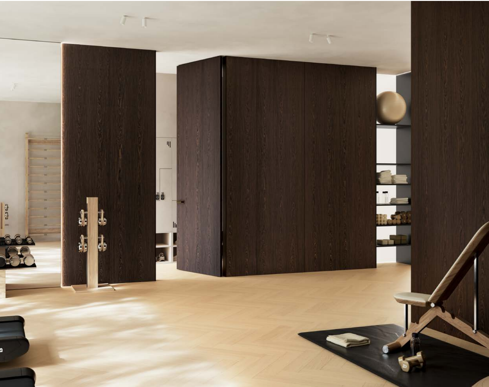
finition vernis transparent