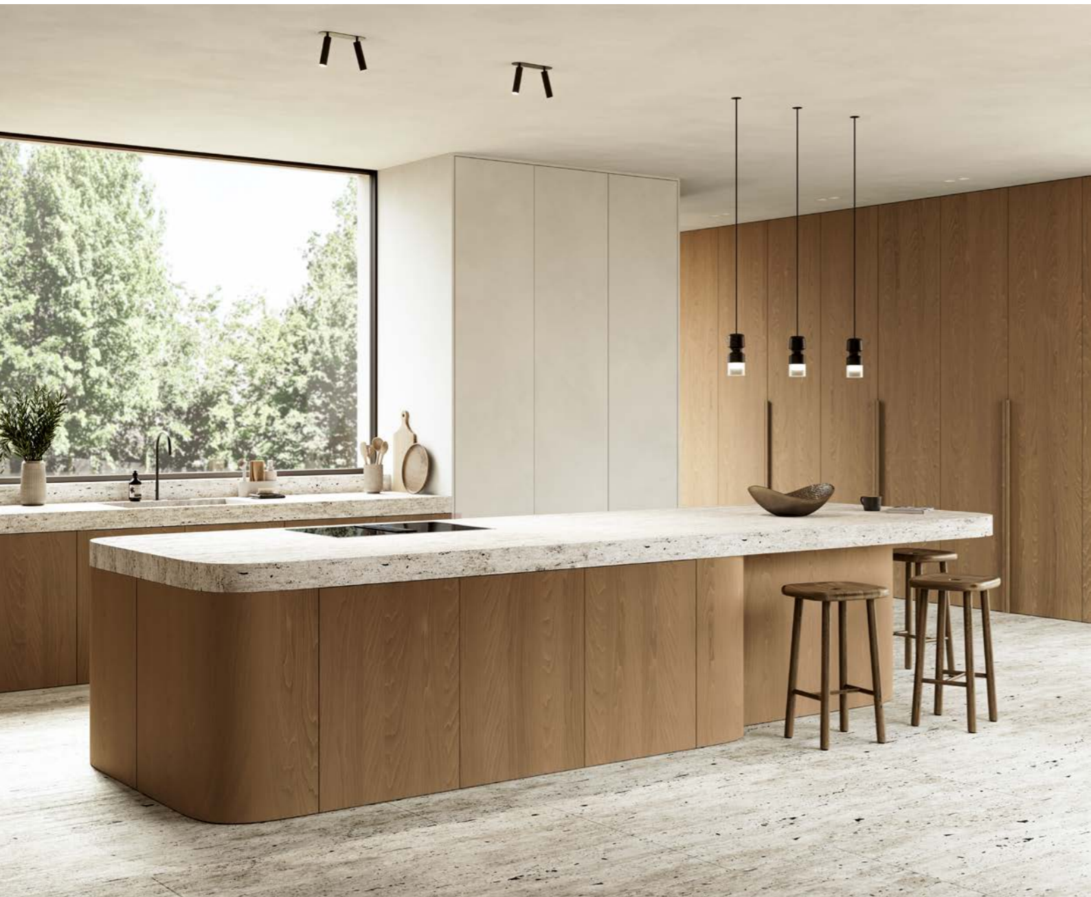
finition vernis transparent