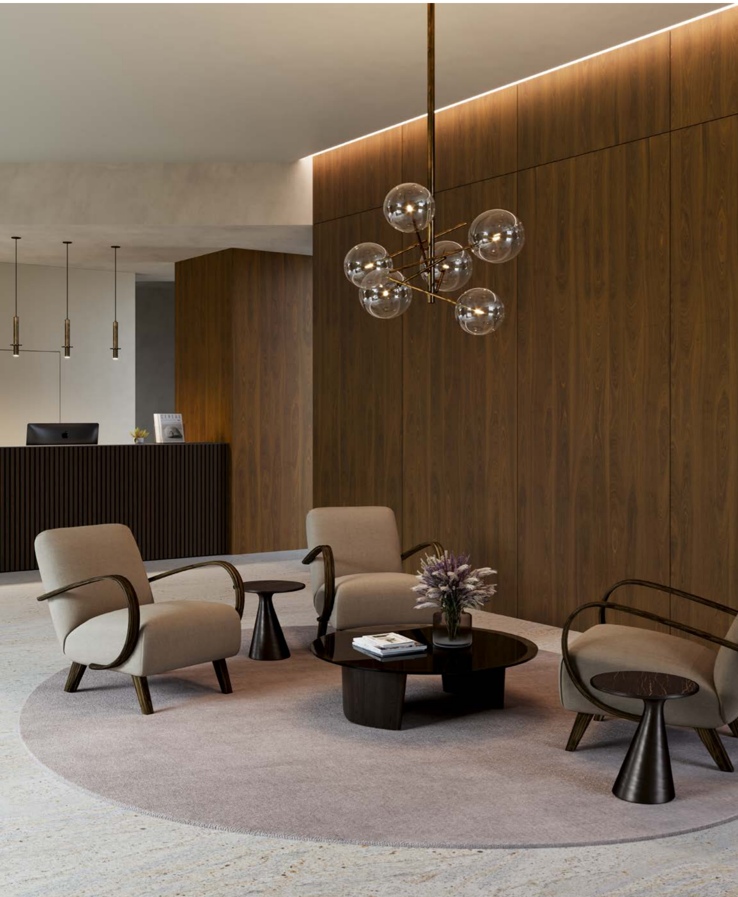
finition vernis transparent