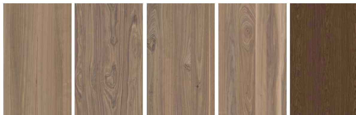
Elegance Mystique Heritage Artisan Symphony Infinite