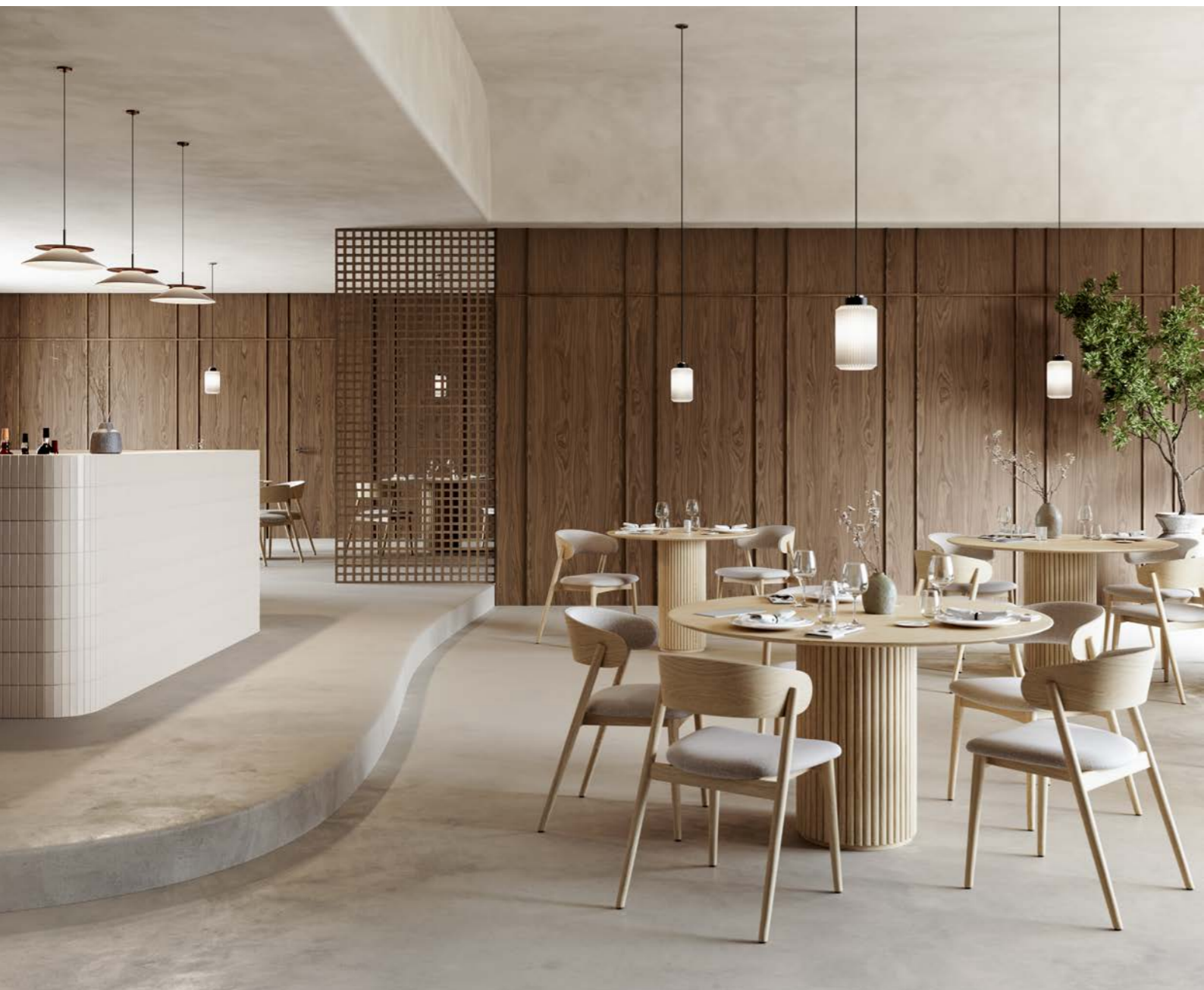
finition vernis transparent