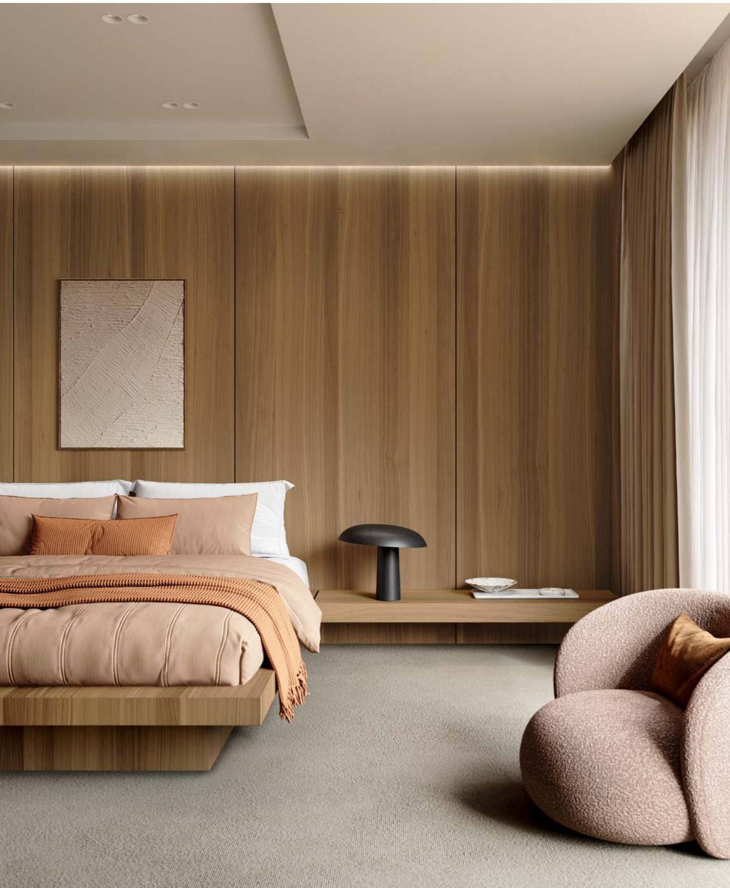
finition vernis transparent