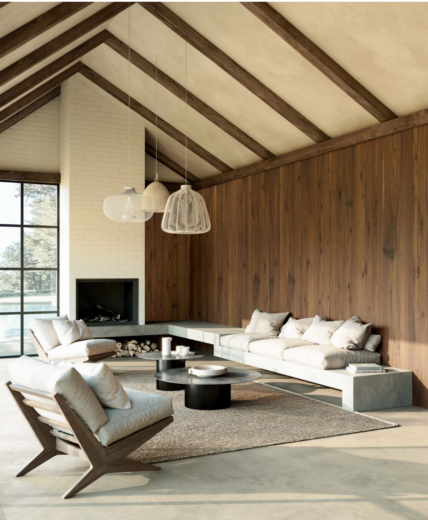
finition vernis transparent