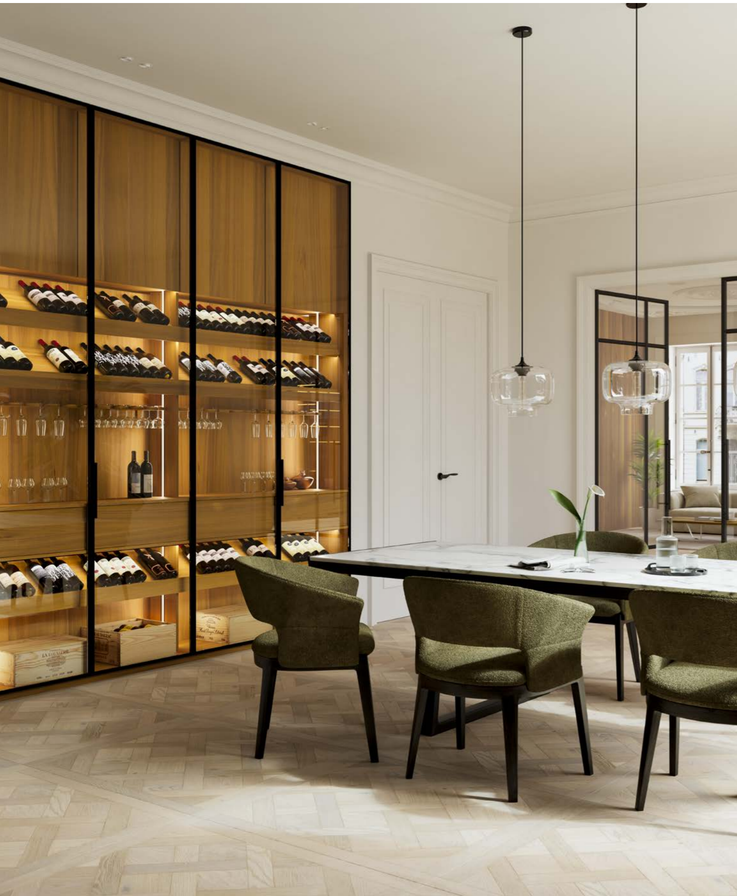
finition vernis transparent